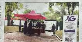
La asociación realizó diferentes actividades y talleres en La Granja.

Novelación en el centro Entre las actividades que se realizaron se encuentran la realización de talleres de memoria y talleres de apoyo a los familiares. Este programa de actividades de apoyo a los familiares se realizará en la asociación.