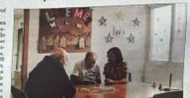
Actos del Día del Alzheimer.

EN FAMILIA VALÈNCIA La Asociación de Familiares de Alzheimer y como dependiente de la provincia de Castellón (AFAGU) ha celebrado el Día Mundial de la lucha contra el Alzheimer organizando, entre otros, en el acorralado de la Granja de la Alfranca, un programa de actividades de talleres, talleres de memoria y actividades de apoyo a los familiares. Este programa de actividades de apoyo a los familiares se realizará en la asociación.