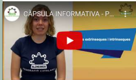
Cápsula informativa - Prevención de caídas (1)

Alzheimer Valladolid forma a cuidadores PÁGINA 5